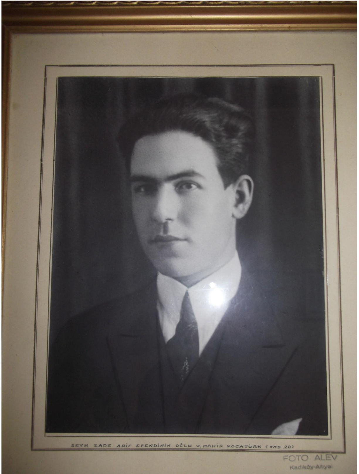
Vasfi Mahir Kocatürk'ün 1927 yılında çekilmiş bir fotoğrafı.