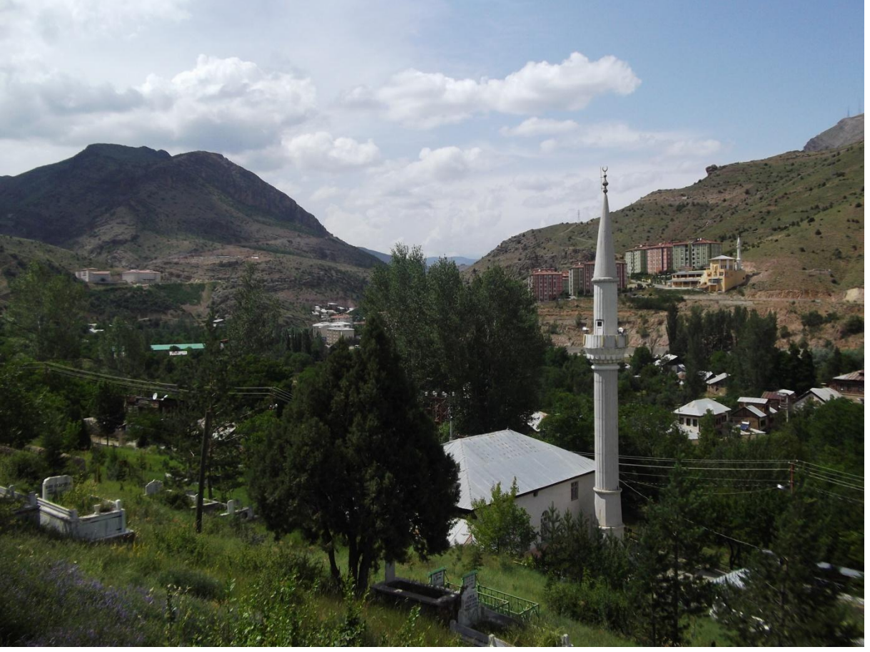
Vasfi Mahir Kocatürk'ün doğduğu Bağlarbaşı Mahallesi'nin genel bir görünüşü.